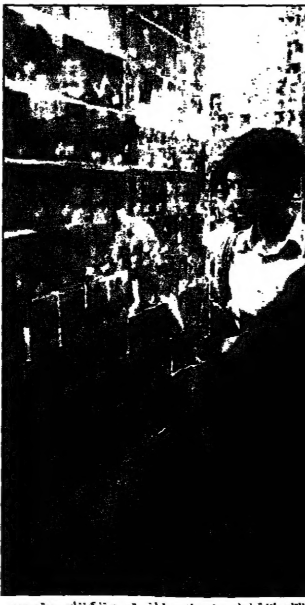
الخبير الاقتصادي السوداني محمد هاشم عوش ينتقد بيع مشاريع رابحة بأسعار زهيدة من قبل الحكومة.